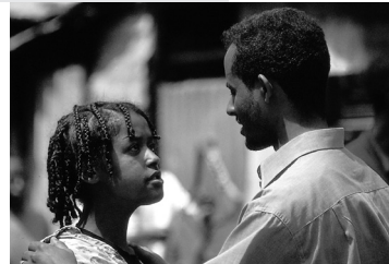
Die Stiftung will das Schweigen unter Jugendlichen brechen – Jugendliche bei einer Theateraufführung in Addis Abeba, Foto: Stiftung Weltbevölkerung

Um langfristige Verhaltensänderungen bei den Jugendlichen zu bewirken, ist Sexualaufklärung allein nicht ausreichend. Die Aufklärungsarbeit in den Jugendklubs setzt daher tiefer an: beim traditionellen Rollenverständnis von Mann und Frau in der Gesellschaft. Zusätzlich zur Aufklärung